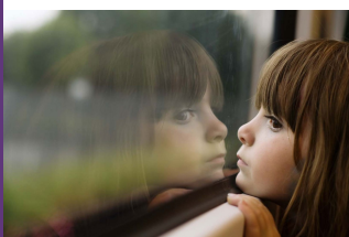
Jour & Familjehem

Studierna visar också att resultaten är ungefär som i USA, det vill säga att metoden minskar barnens beteendeproblematik och stärker föräldrarollen.